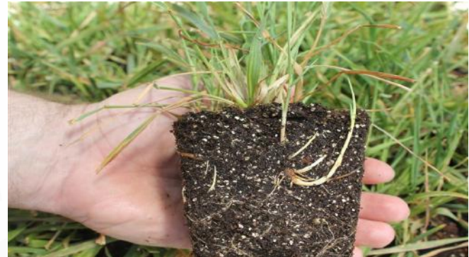
Generiline formulatsioon 1080 g/ha