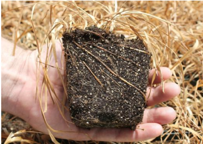
Roundup Flex 1080 g/ha